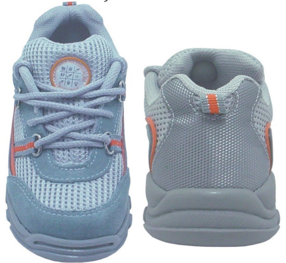
Tênis Colegial Fundamental (numeração 25 ao 42)