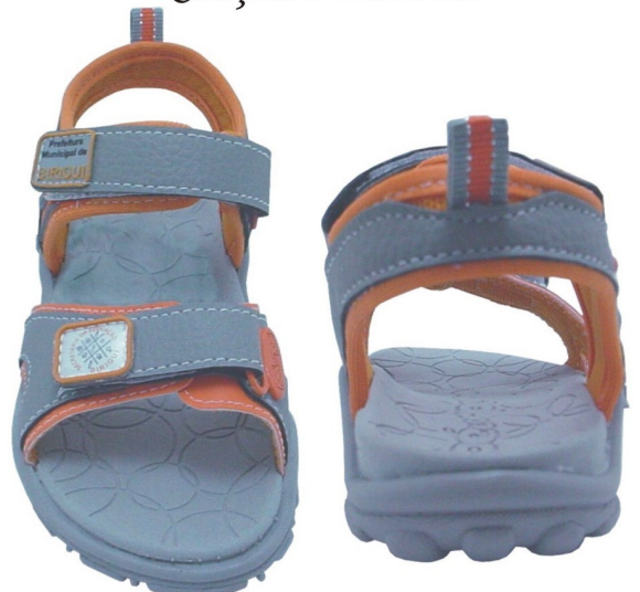
Papete Colegial Fundamental (numeração 25 ao 42)