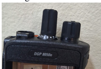
Imagem real do aparelho com seu modelo.

As imagens abaixo são referentes aos aparelhos que pertence ao acervo da Prefeitura: