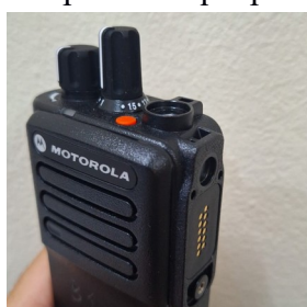
Imagem real do aparelho para conexão do PTT