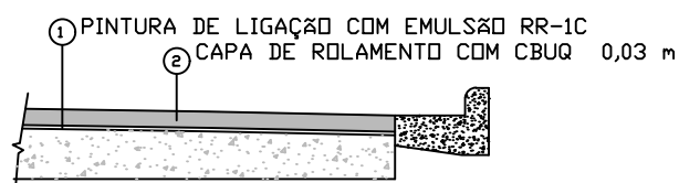
CORTE TRANSVERSAL DO RECAPEAMENTO ASFÁTICO SEM ESCALA