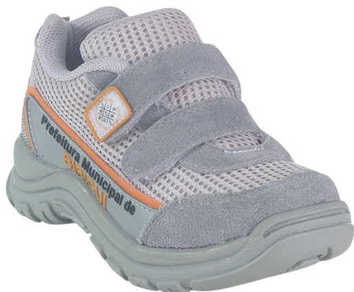
Tênis Colegial Infantil (numeração 25 ao 42)