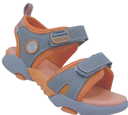
Papete Infantil (numeração 20 ao 24)