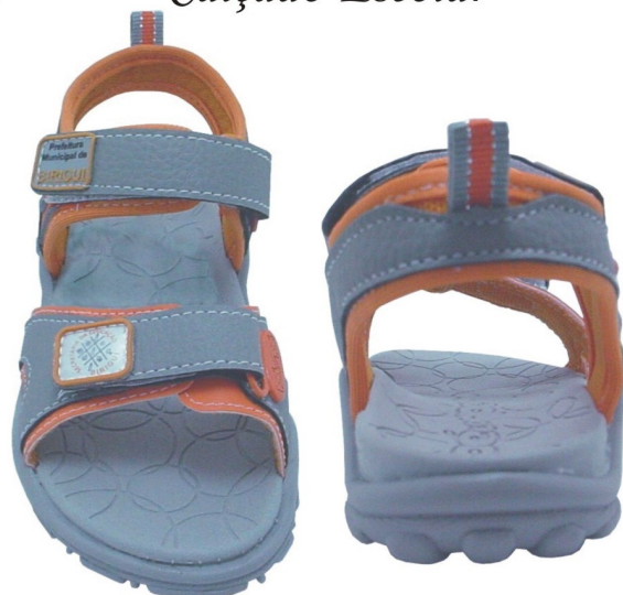
Papete Colegial Fundamental (numeração 25 ao 42)