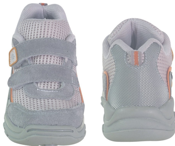
Tênis Colegial Infantil (numeração 25 ao 42)