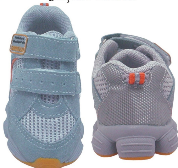
Tênis Infantil (numeração 20 ao 24)