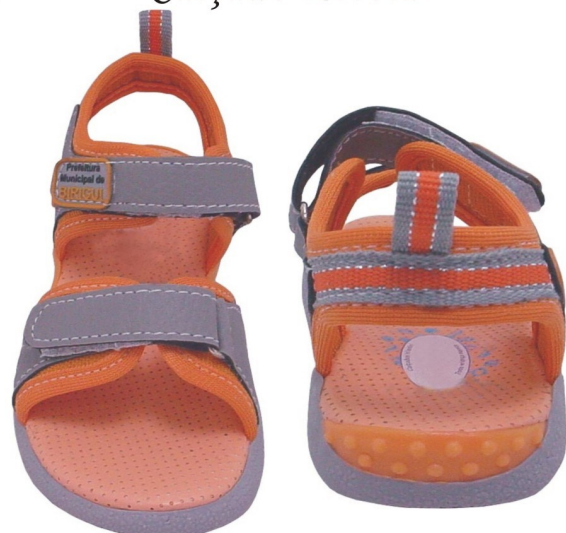
Papete Infantil (numeração 20 ao 24)