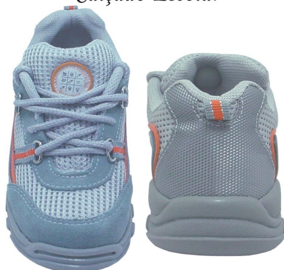
Tênis Colegial Fundamental (numeração 25 ao 42)