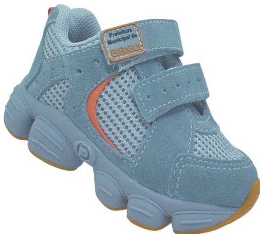
Tênis Infantil (numeração 20 ao 24)