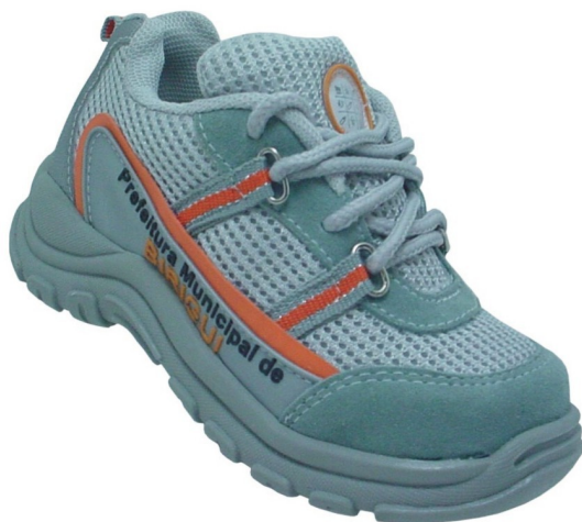
Tênis Colegial Fundamental (numeração 25 ao 42)