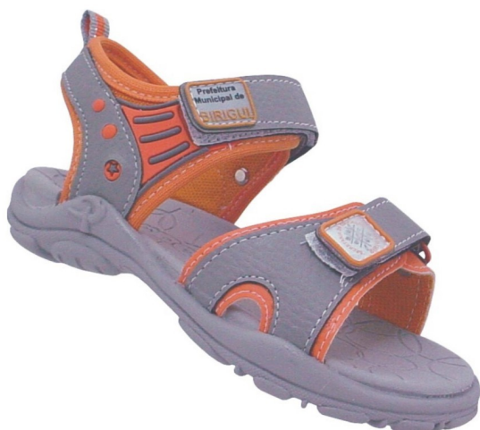
Papete Colegial Fundamental (numeração 25 ao 42)