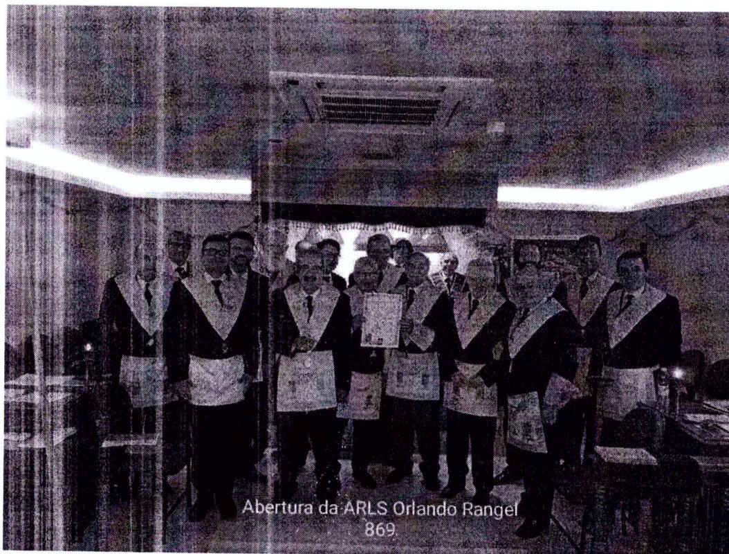
Abertura da ARLS Orlando Rangel 869

Fazia parte da Loja Maçônica, onde foi Venerável Mestre de 2010 a 2011. Foi investido no Grau de Grande Inspetor Geral, 33º em 13 de julho de 2013 e, em 2019, João e outros maçons fundaram a loja "ARLS Orlando Rangel 869".