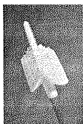
Cervex Brush Combi

Ou seja, orientamos a obtenção de 75% de escovas Cervex Brush Combi e 25 % de escovas Cervex Brush.